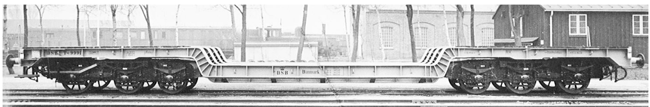
TM 9991 som ny i 1956.